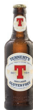
Gluten Free 5% Gluten Free Lager