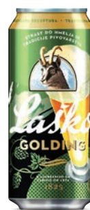
Golding Svetlo 5,4% Lager