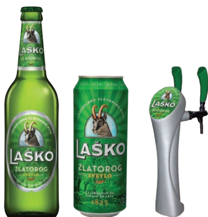
Zlatorog Svetlo 4,9% Lager

Bottiglia da 0,66l e 0,33l Lattina da 0,50l e 0,33l Fusto da 30l